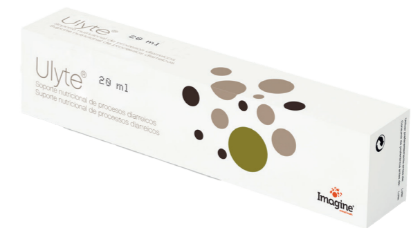
Caja con 1 jeringa de gel oral de 20 ml.