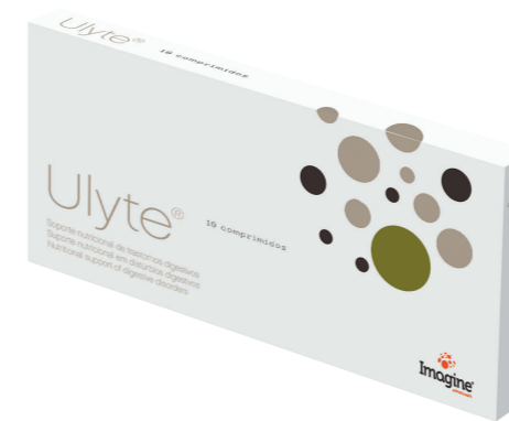
Caja de 10 comprimidos de 2 g.